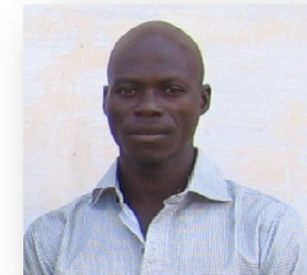
Zone III ( arrondissements de Gouandé et Tchahoun –cossi)