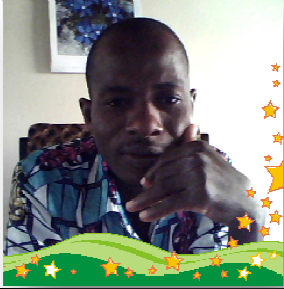
CP/ - CHARGE/PRODUCTION ET DE FORMATION